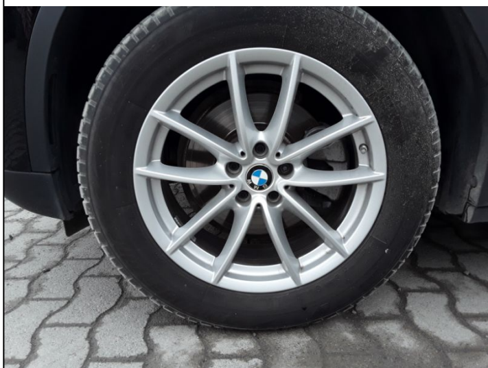
Felge Vorne Links