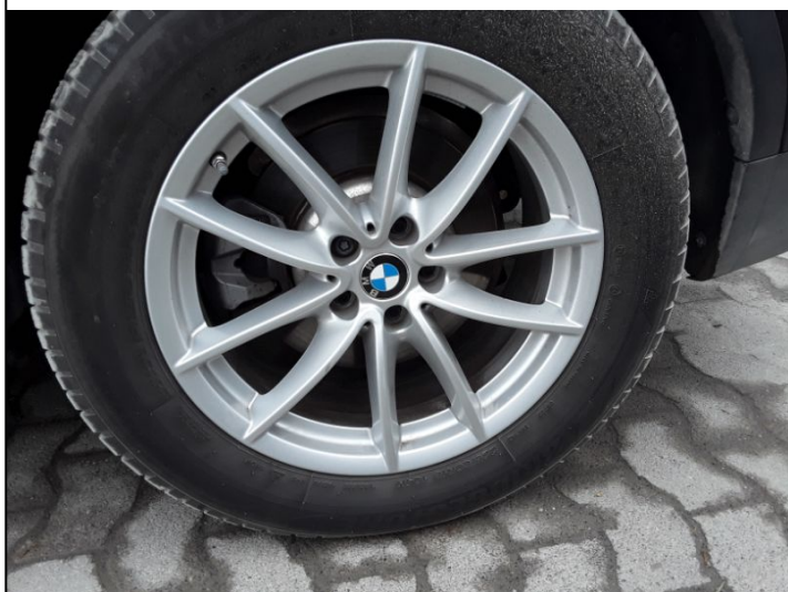
Felge Hinten Links