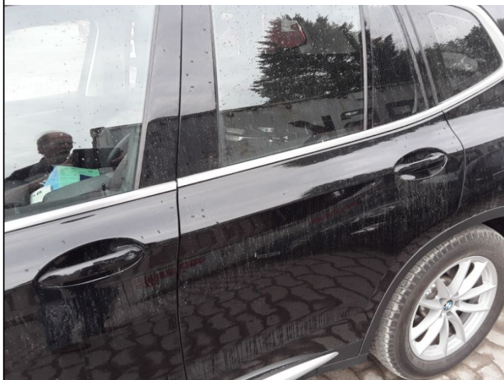
Foto vom Fahrzeug unter erschwerten Bedingungen