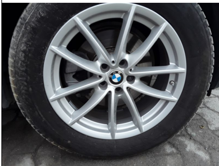
Felge Vorne Rechts